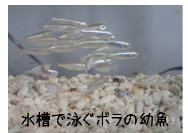
水槽で泳ぐボラの幼魚

捕まえた生き物を調べたいときは、ぜひ、ふるさと館へお越しください。図鑑で調べたり、お魚に詳しいスタッフに聞いたりすることができます。実際に海に行けなくても、ふるさと館にある水槽や海に関するイベントに参加することで、生き物に親しむ機会があります。10月8日(月・祝)には“観察会「浜辺の小さな生き物たち」”を開催いたしますので、ぜひご参加ください。(滝本)