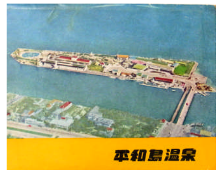
平和島温泉絵はがき(昭和30年代前半)

東京府による京浜運河計画の一環として昭和14年(1939)に誕生した未完成の人工島。戦時中は捕虜収容所、戦後はA級戦犯の仮収容所となり、その後、一時東京都職員住宅が建設された。昭和29年(1954)、京浜急行電鉄グループである現在の京浜開発株式会社が海面を利用して競艇事業をスタートさせた。以降、温泉、プール、遊園地などレジャー施設として開発された。城南住民にとっては、家族や親戚で娯楽を楽しんだ懐かしい思い出の場所。現在は周辺も埋め立てられて島の面影はないが、レジャー施設BIG FAN平和島として娯楽を提供している。⑩の番号のあたりがかつての平和橋。