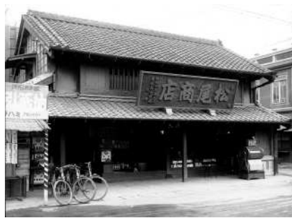
昭和2年ごろの写真 (株式会社松尾所蔵)

寛文9年(1669)創業、大森の海苔養殖の草創期からの海苔問屋。戦災や環七の整備を経て、現在の店舗になった。店舗販売のほか、通信販売やふるさと小包などで創業以来約340年の味と伝統を伝えている。