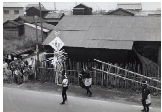
弁天通りを出初式に向かう羽田消防団 昭和29年