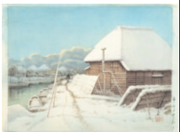
<左> 「森ヶ崎 雪後之夕」川瀬巴水肉筆 <下> 「大日本物産図会 武蔵国浅草海苔製図」 明治十年 歌川広重 (三代)