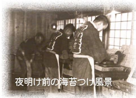
夜明け前の海苔つけ風景

（この文章は、「おもしろひがし地域情報『いつつのわ』第七〇号」（わがまち大田区大森東地区推進委員会平成二十年七月）に掲載したものを再掲載させていただきます。）